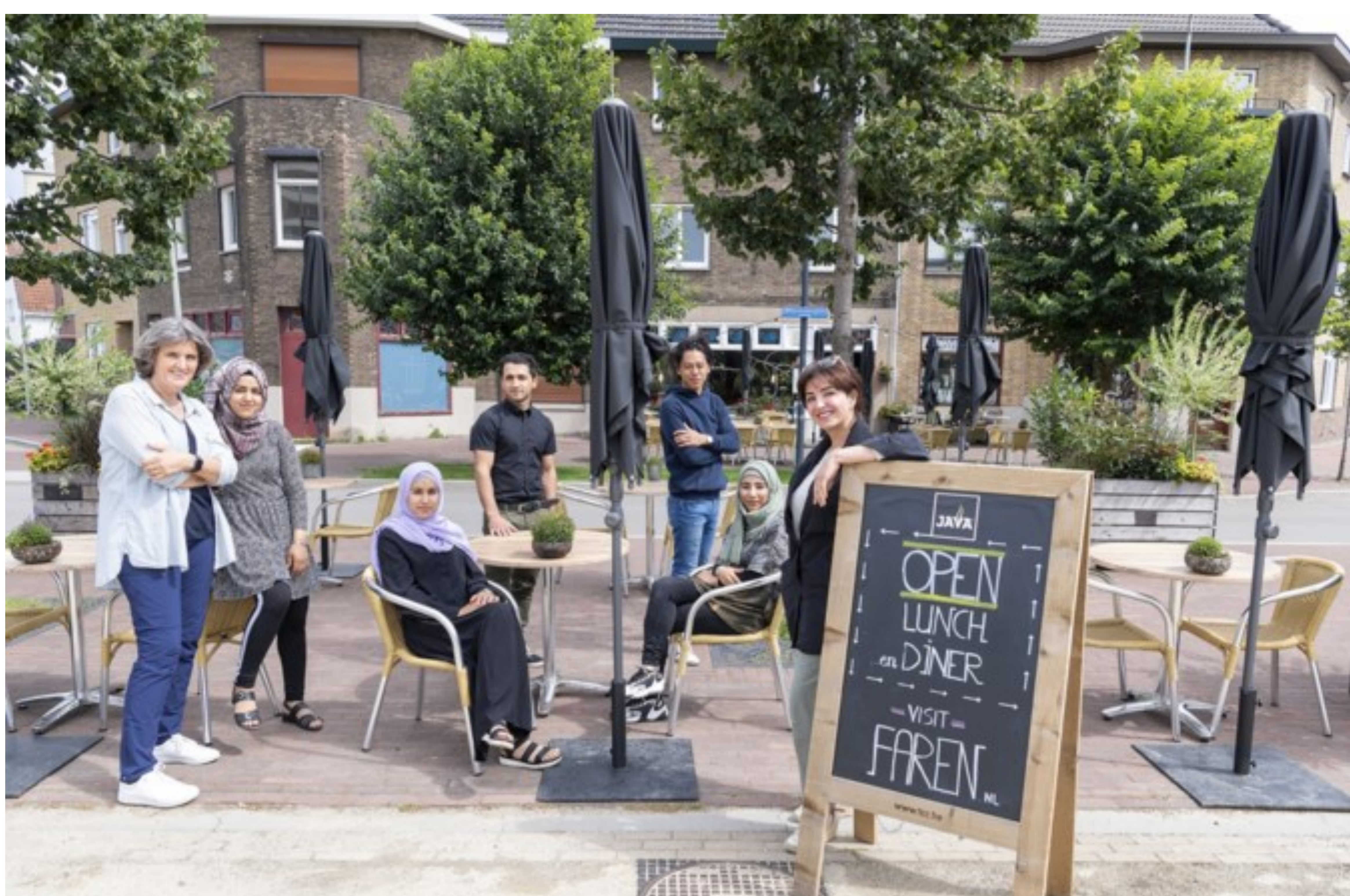
Een deel van het personeel van restaurant Farèn.