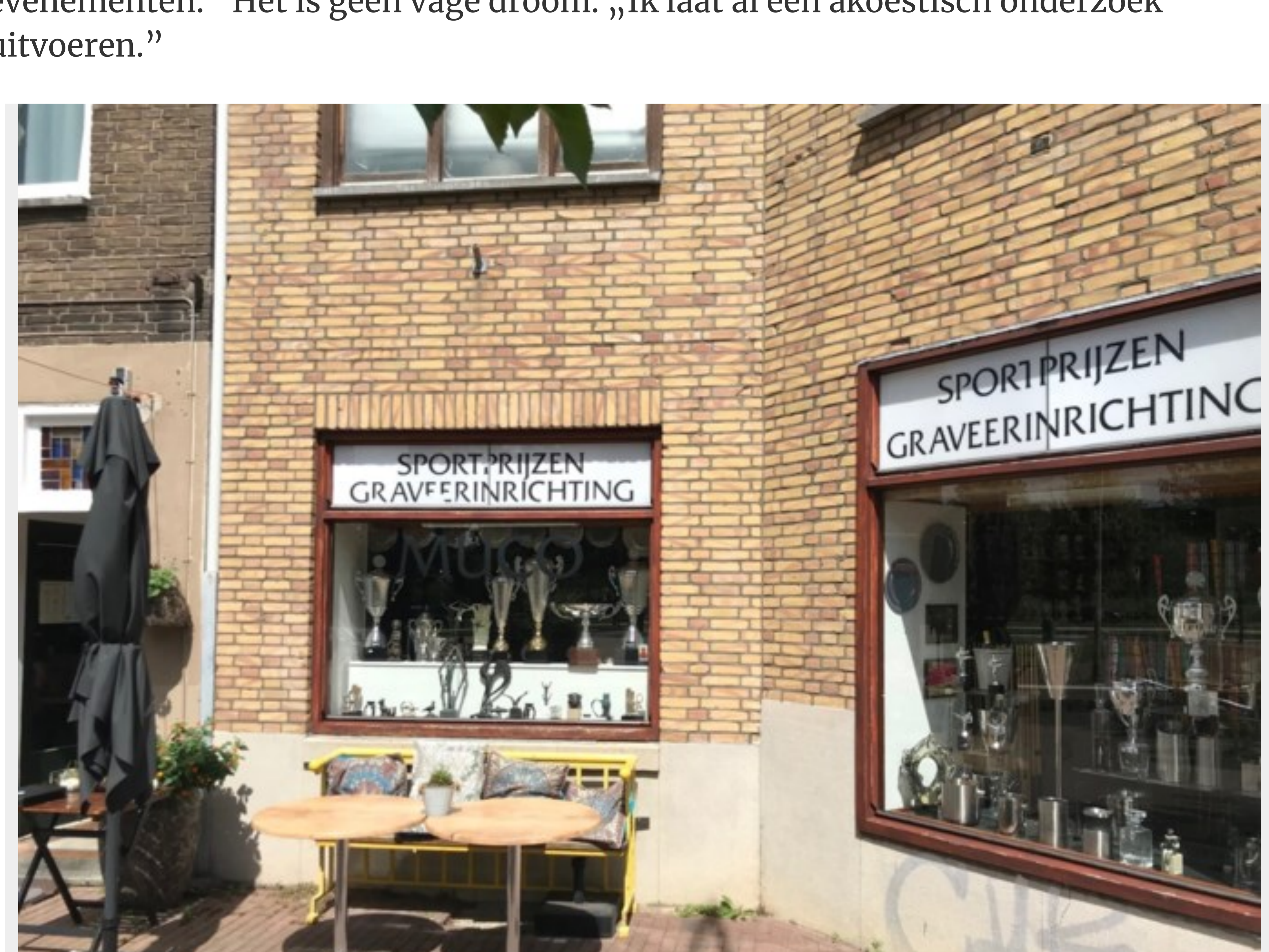
Hier komt volgend jaar een ijszaak to go.

Maar goed, Sallak ziet veel perspectief. „Aan de Groene Loper komen 1100 woningen en de gemeente wil de binnenstad ontlasten. Daarom denk ik aan een bloemrijk plein, helemaal omzoomd door plantenbakken en helemaal terras, een plek ook voor evenementen.” Het is geen vage droom. „Ik laat al een akoestisch onderzoek uitvoeren.”